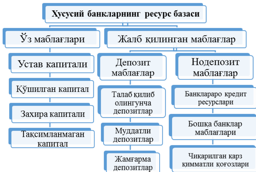
1-расм. Хусусий банкларнинг ресурс базасини шакллантириш механизми.

сотиб олинади ва иккинчидан, жалб қилиш ташаббуси банкнинг ўзига тегишли бўлади.