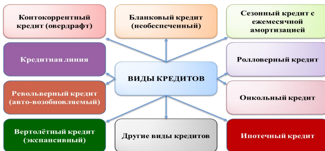
Рис. 1 – Разнообразие кредитных продуктов коммерческих банков [1].

В итоге имеем - банк не очень заинтересован в промышленной группе, т.к. это ограничивает его бизнес нормативами ЦБ, а промышленная группа не очень заинтересована в банке, т.к. он не способен обеспечить её разнообразными кредитами (см. рис. 1).