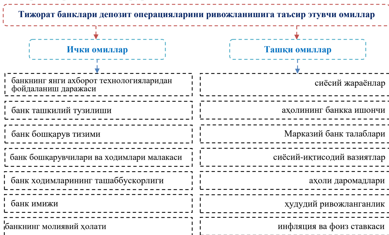
1-расм. Тижорат банклари депозит операцияларини ривожланишига таъсир этувчи омиллар.

Тижорат банклари депозит базасини кенгайтиришда банк депозит операцияларини ривожлантириш зарур ҳисобланади. Бунда, биринчи навбатда тижорат банклари депозит операцияларини ривожланишига таъсир қилувчи омилларни кўриб чиқиш зарур.