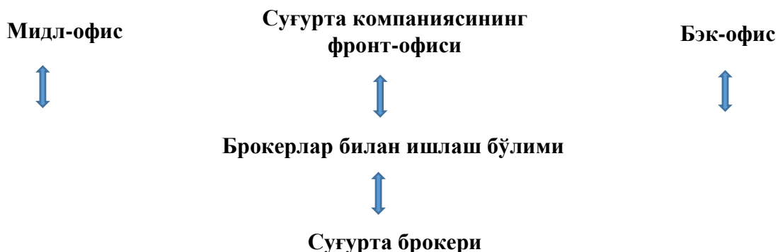
2-расм. Брокерлар билан ишлашнинг марказлашган модели 2

Юқорида кўрсатилган камчиликларни ҳисобга олган кўпчилик суғурта компаниялари суғурта брокерлари билан ишлашнинг марказлашган моделини танлашади ва ўзларида суғурта брокерлари билан ишлаш бўлимларини ташкил этишади.