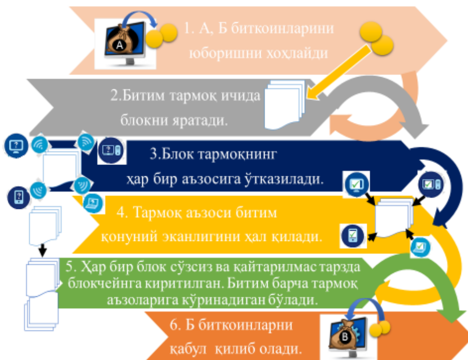
1-расм. Блокчейн биткоин технологиясининг ишлаш

Блокчейн биткоиннинг ишлашини қуйидагича босқичда тавсифлаб бериш мумкин: операцияда иштирок этаётган иккала иштирокчичининг ҳам битим тузишга розилик билдириши; блокчейн технологиясидан фойдаланган ҳолда битим шифрланиши ва келишув асосида тасдиқланиши; кейинги босқичга ўтиш орқали битим мос келади ва у охириги блокчейн блокида блокировка қилинади; охириги босқичда блок занжири тармоқнинг барча тугунларида (иштирокчиларида) кўпайтирилади.