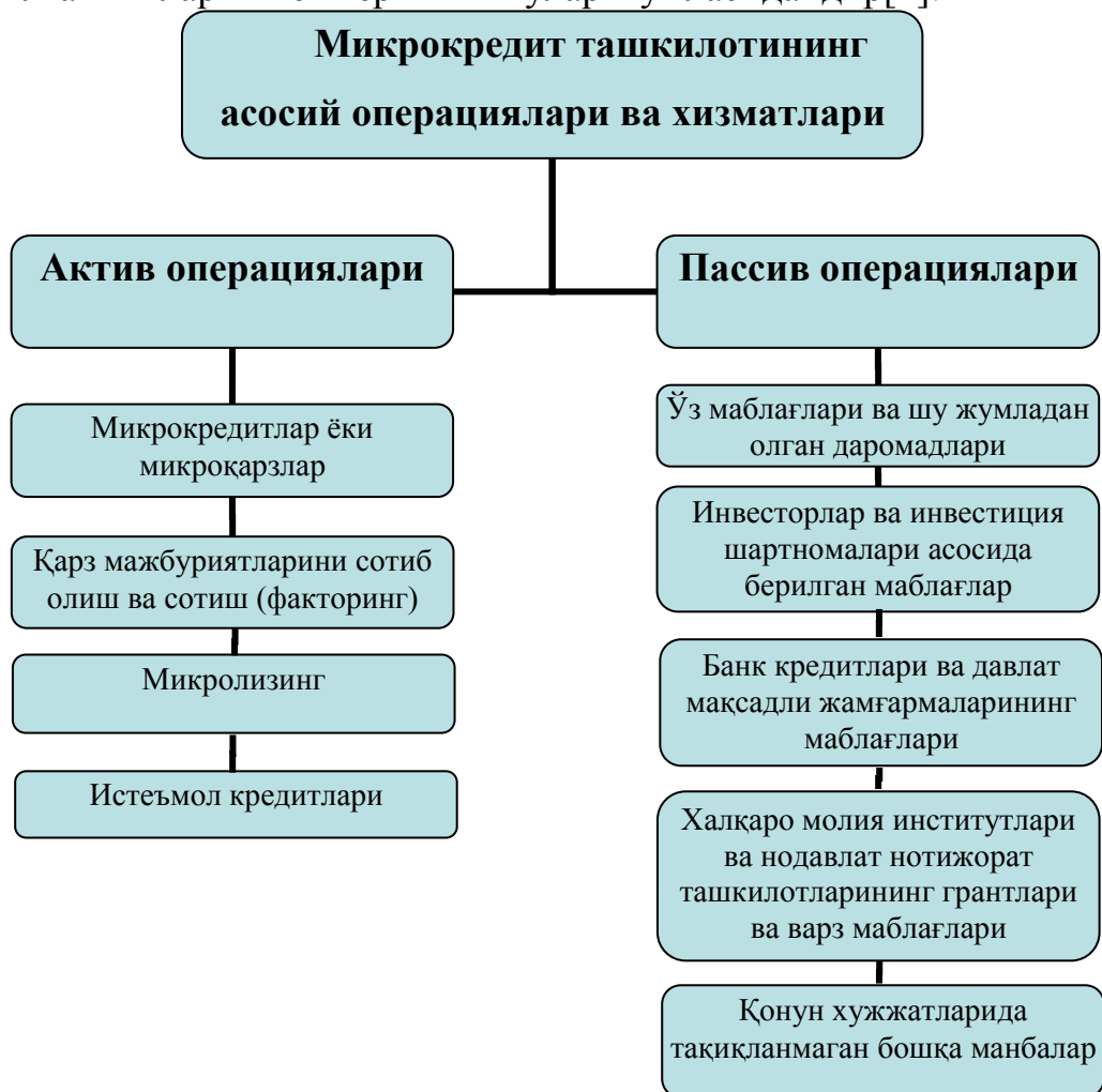
1-расм. Микрокредит ташкилотлари операциялари таснифи[2]*.

Ўзбекистон Республикаси Президентининг 2010 йил 26 ноябрдаги «2011-2015 йилларда республика молия-банк тизимини янада ислоҳ қилиш, унинг барқарорлигини ошириш ва юқори халқаро рейтинг кўрсаткичларига эришишнинг устувор йўналишлари тўғрисида»ги ПҚ-1438-сонли Қарорида, айнан, нобанк ташкилотлари фаолиятини такомиллаштириш чора-тадбирлари белгилаб берилди. Бунда нобанк ташкилотлари фаолиятини янада ривожлантириш, микрокредитлаш ва бошқа микромолиявий хизматлар кўрсатиш ҳажмларини кенгайтириш, нобанк ташкилотлари ва улар томонидан кўрсатиладиган хизмат турлари тармоғини кенгайтириш, нобанк ташкилотларида ҳисоб юритилишини, улар фаолиятини тартибга солиш ва назорат қилиш усулларини янада такомиллаштириш, ахборот-алоқа технологияларини жорий этиш, нобанк ташкилотлари ходимларининг малакаларини ошириш, микромолиялаш соҳаларини ривожлантириш бўйича амалга оширилган ишларни кенг ёритиш шулар жумласидандир[1].