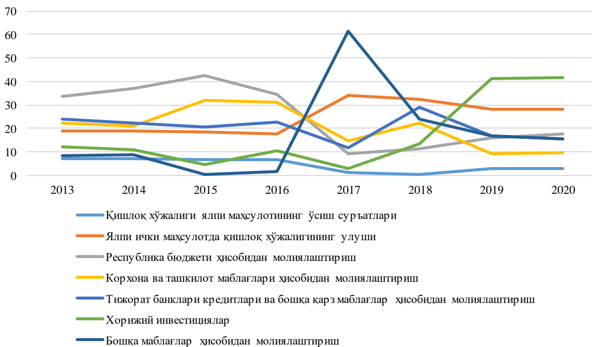
3-чизма. Қишлоқ, ўрмон ва балиқ хўжаликлари фаолиятида асосий иқтисодий кўрсаткичлар ва асосий капиталга киритилган инвестиция манбаларининг ўзгариши, %

Илмий тадқиқот ишимизда фермер хўжаликлари фаолиятдан олинган фойда ва фаолиятга киритилган инвестиция маблағлари ўртасидаги муносабат ҳамда унга таъсир этувчи омилларга иқтисодий баҳо бериш учун Самарқанд вилояти Зарафшон дарёси ҳудудида жойлашган 2