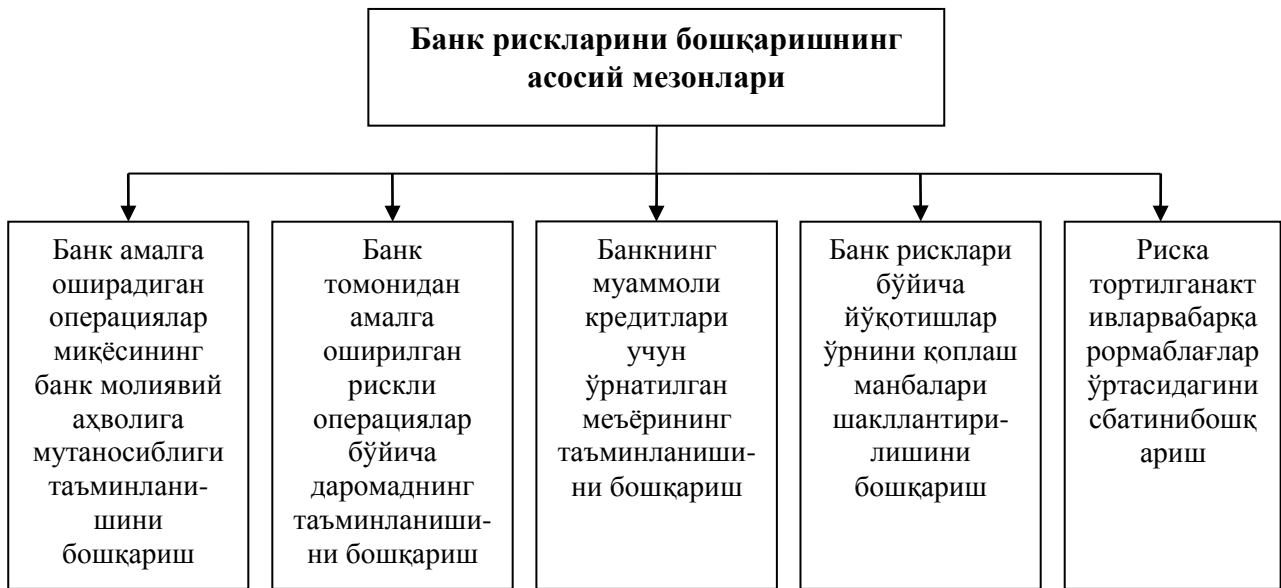
3- расм. Банк рискларини бошқаришнинг мезонлари (расм муаллиф томонидан тайёрланди).

Албатта, Марказий банк банк рискларини пасайтириш ва банкларнинг молиявий барқарорлигини таъминлашда қатор иқтисодий нормативларни жорий этган. Хусусан, тижорат банкларининг кредитлар билан боғлиқ rischi Марказий банк томонидан 2015 йил 13 июнда тасдиқланган, Адлия вазирлигида 2015 йил 14 июлда 2696-сон билан рўйхатдан ўтказилган “Тижорат банкларида активлар сифатини таснифлаш ва активлар бўйича эҳтимолий йўқотишларни қоплаш учун захиралар шакллантириш ҳамда улардан фойдаланиш тартиби тўғрисида”ги Низом[4] га асосан бешта гуруҳга таснифланади. Жумладан, стандарт, субстандарт, коникарсиз, шубҳали ва умидсиз гуруҳларга таснифланади.