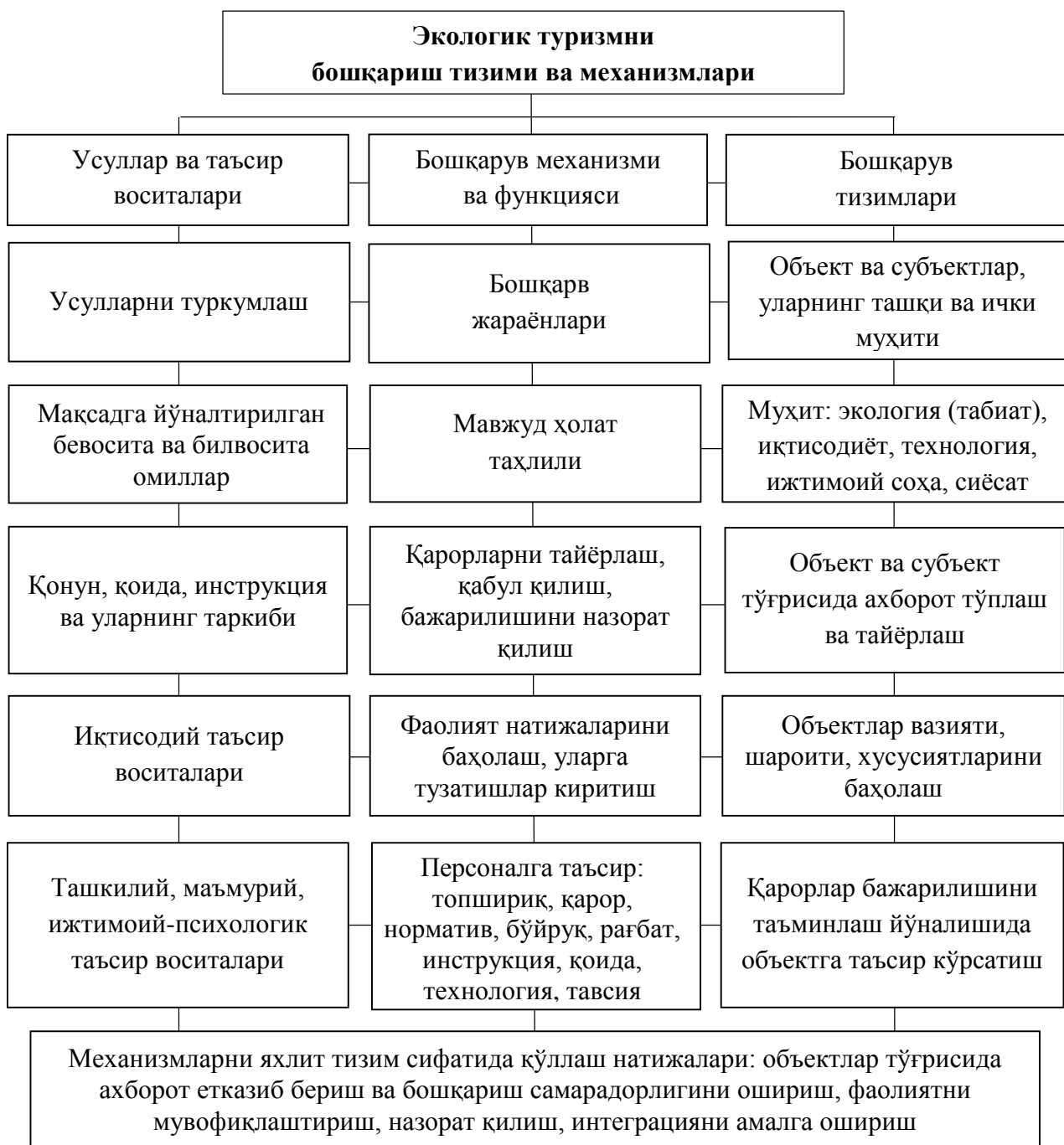
2-расм. Ўзбекистонда экологик туризмни бошқариш тизими ва механизлари схемаси 2

Туризм-рекреация комплексининг яхлит тизим сифатида фаолият юритишининг асосини унинг қўйидаги кичик тизимлари ўртасидаги яқин ва самарали ўзаро таъсир ташкил этади: