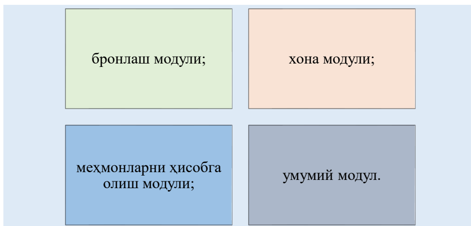
1-расм. Фронт-офиснинг асосий модуллари [4]

Бронлаш модули меҳмонхона сўровини тезлаштириш ва муайян хонани мақбул вақтда, даромад ва прогноз бўйича меҳмонга тақдим этади. Бошқача қилиб айтганда, хона мавжудлиги ва бандлиги ҳолатини тез аниқлашга ёрдам беради, хоналарни автоматик брон қилишни электрон почта, факс ёки бошқа интернет воситалари орқали амалга оширишга ёрдам беради.