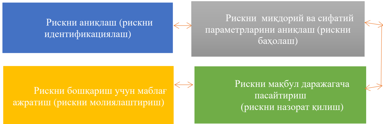
2-расм. Рискларни бошқаришнинг асосий жараёнлари 4

белгиланади, жисмоний ва юридик шахсларнинг рискларини бошқаришнинг афзалроқ услуби, олдиндан белгиланган усуллар бўйича тайёрланган шахслар томонидан профессионал даражада амалга оширилади, деб қабул қиламиз. Юридик ва жисмоний шахслар учун рискларни бошқариш тизимининг элементи сифатида суғуртанинг ривожланиши рискларни бошқаришда юзага келадиган асосий жараёнларнинг хусусиятлари билан белгиланади (2-расм). Бунда ушбу жараёнлар бири-бирдан келиб чиқади, улар аниқ иерархик тартиб ва фарқланишга эга эмас, улар кучли ўзаро таъсир билан тавсифланади.