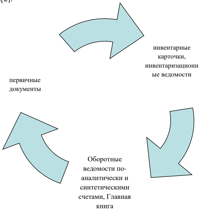
Рис.№3. Кругооборот аудита основных средств.

Новая редакция Закона «Об аудиторской деятельности» №ОПК-677 от 25.02.2021 года, дополненная дополнительными изменениями[1].