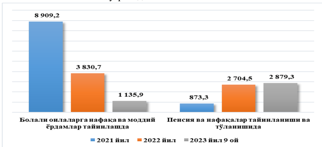
1-расм. Фуқароларнинг давлат пенсия таъминоти тизимидаги молиявий ҳато ва қонунбузилишлар кўрсаткичлари (млн сўмда)

Хусусан, ички аудит хизматлари томонидан соҳада 2021 йилда 5504 та ҳолатда 9,9 млрд сўмлик, 2022 йилда 3134 та ҳолатда 6,6 млрд сўмлик молиявий ҳато ва кмчиликлар аниқланган бўлса, 2023 йилнинг ўтган 9 оyi давомида 1265 та ҳолатда 4,0 млрд сўмлик молиявий ҳато ва қонунбузилишлар аниқланган.