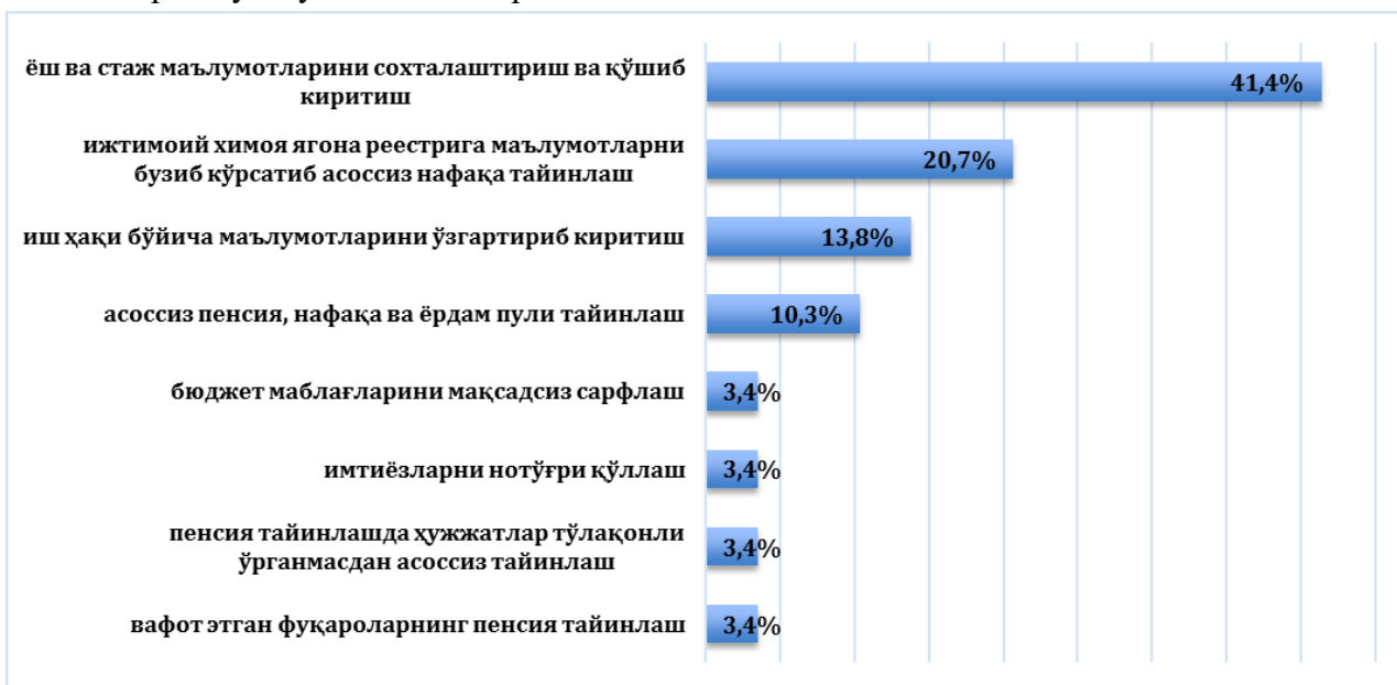
1-расм. Фуқароларнинг давлат пенсия таъминоти тизимидаги ҳуқуқбузарликлар кўрсаткичлари.

2020-2022 давомида кузатилган ҳуқуқбузарлик ҳолатларининг 27 фоизи жамғарма маблағларини талон-торож қилиш билан боғлиқ ҳолатларни ташкил этса, 73 фоизи коррупцион жиноятларни ташкил этган.