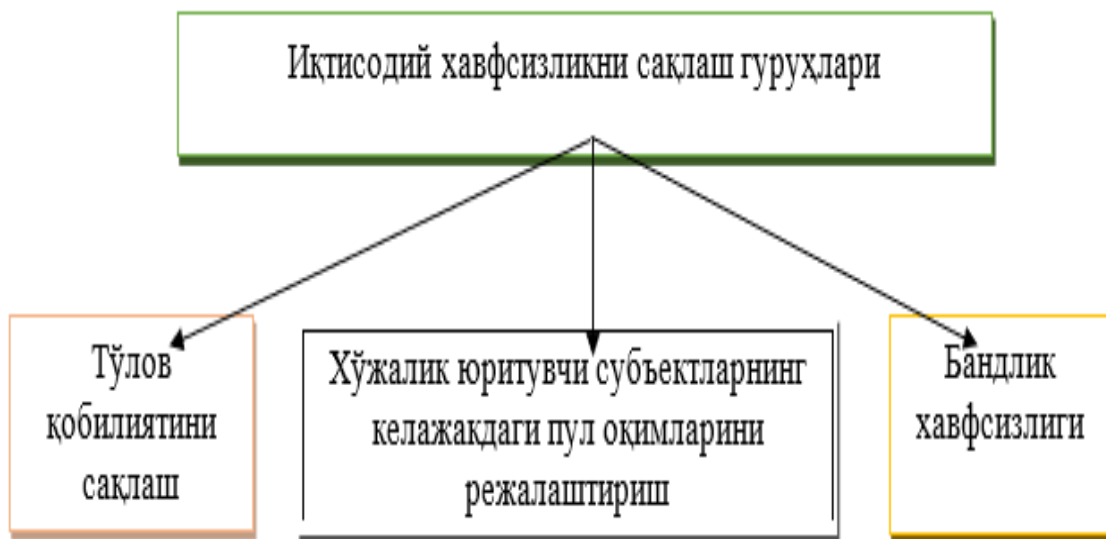
1-расм. Иқтисодий хавфсизликни сақлаш гуруҳлари

Макроиқтисодиётда иқтисодий хавфсизлик бу ташқи омилларнинг мавжудлиги ва таъсирдан қатъи назар, жамиятнинг барқарор иқтисодий ривожланиши ва ижтимоий-иқтисодий барқарорлиги жараёни таъминла-надиган мамлакатда ишлаб чиқариш воситаларининг ҳолати ёки ривожланиш даражасини ифодалайди. Шунингдек, иқтисодий хавфсизлик ҳар қандай давлатнинг ҳолати ёки миллий хавфсизлик даражасини белгиловчи иқтисо-дий, сиёсий, ҳарбий, илмий, технологик ва ижтимоий жиҳатлар ва омиллар мажмуи ҳисобланади.