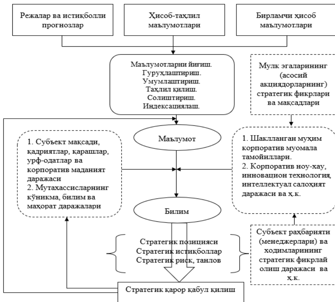
2-расм. Стратегик бошқарув ҳисоби тизимида билимларнинг шаклланиши