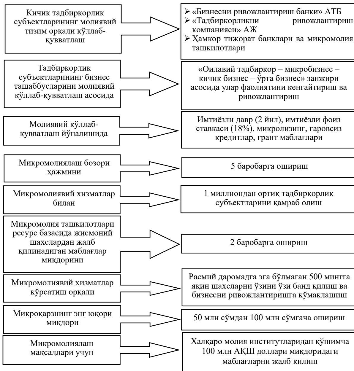
3-расм. Тижорат банклари томонидан микромолиявий хизматлар оммабоплигини ошириш чора-тадбирлари [6]

ноябрда Ўзбекистон Республикаси Президентининг «Тадбиркорлик фаолиятини ривожлантиришда микромолия хизматларининг ўрни ва улушини ошириш бўйича қўшимча чора-тадбирлар тўғрисида»ги ПҚ-364-сон қарори қабул қилинди. Унга мувофиқ, микромолиявий хизматлар оммабоплигини оширишнинг қуйидаги чора-тадбирлари белгиланди (3-расм):