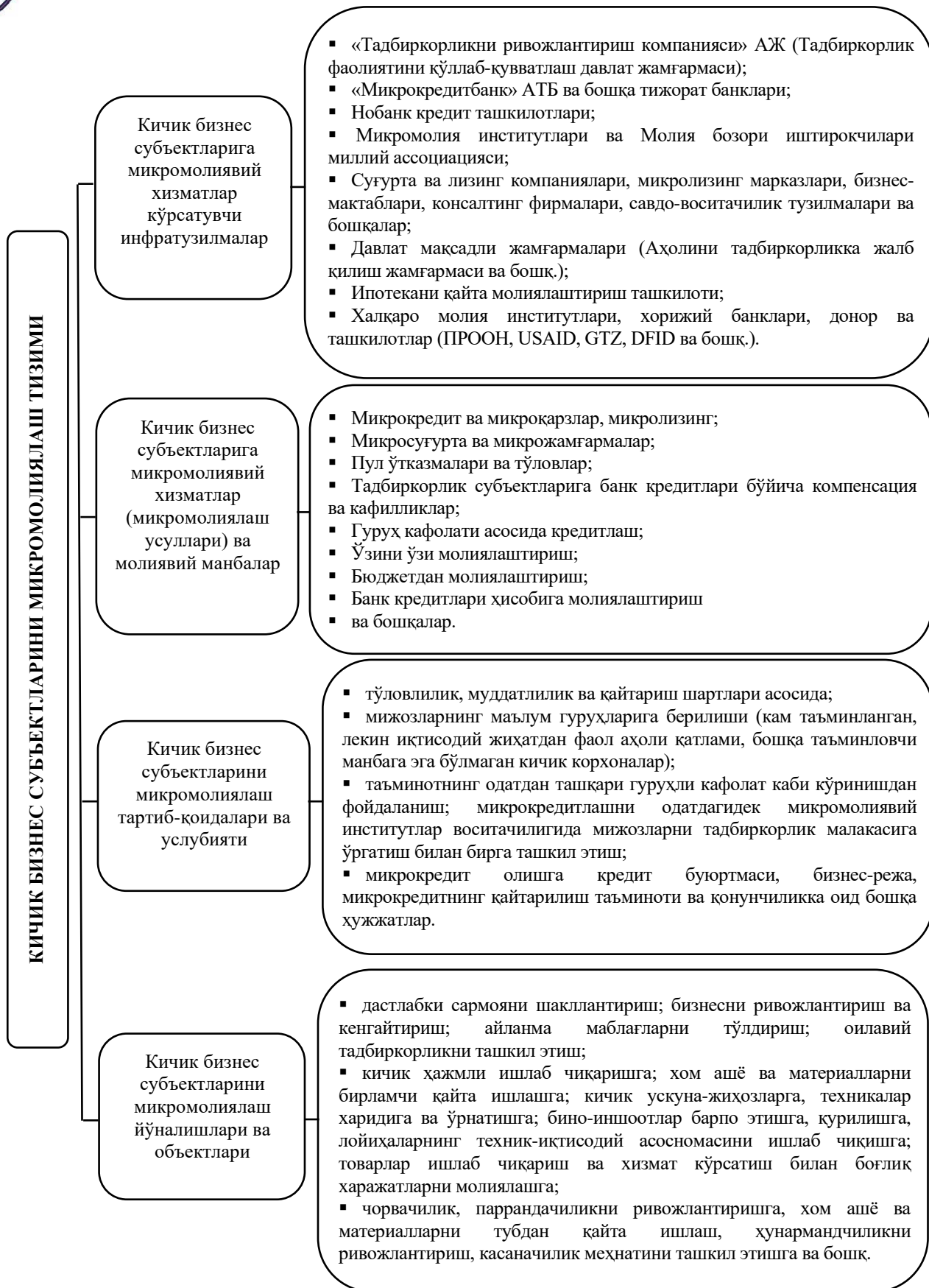
1-расм. Кичик бизнес субъектларини микромолиялаш тизими [3]