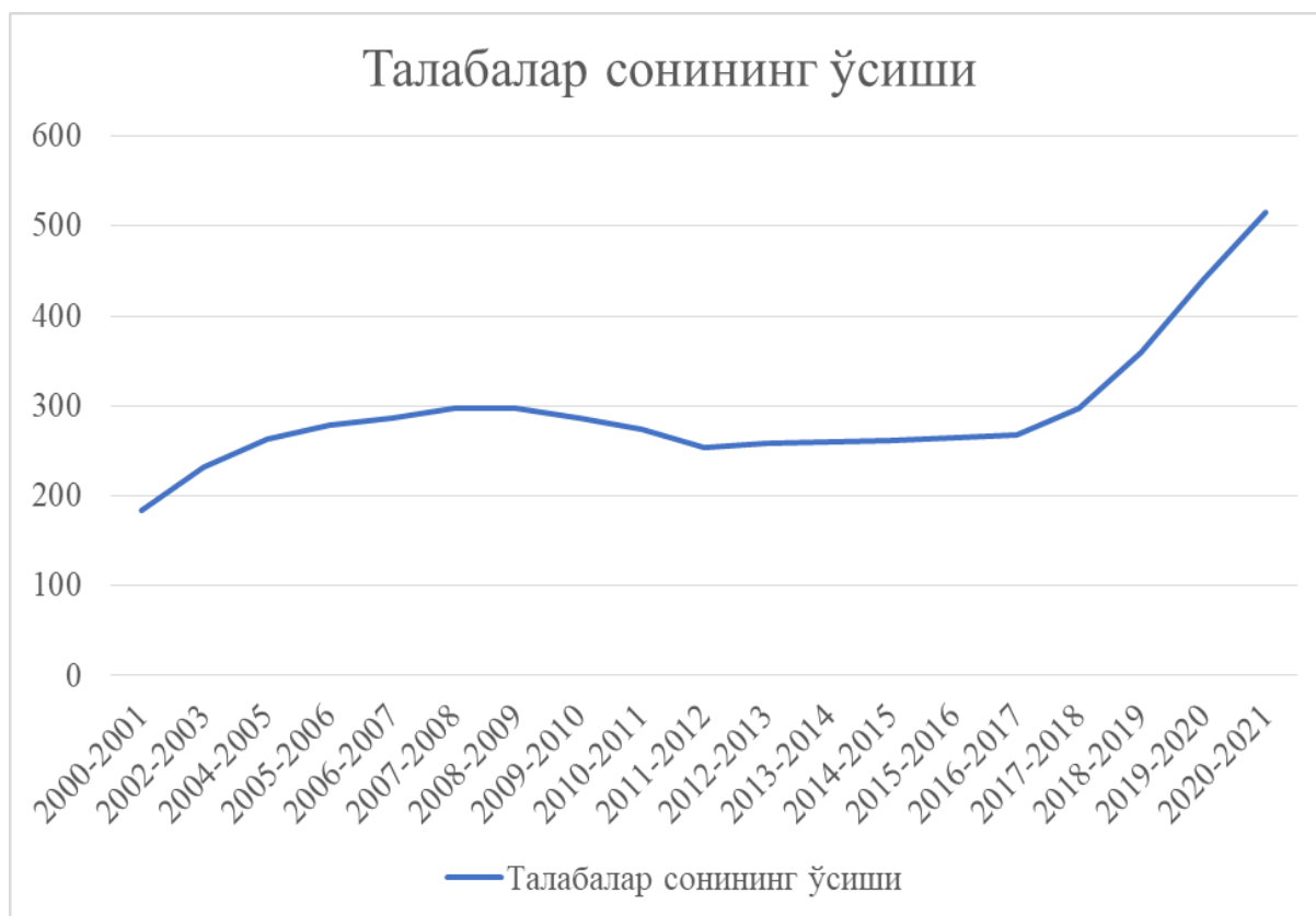
3-расм. Ўзбекистонда олий таълим муассасаларида талабалар сонининг ўзгариши [14]