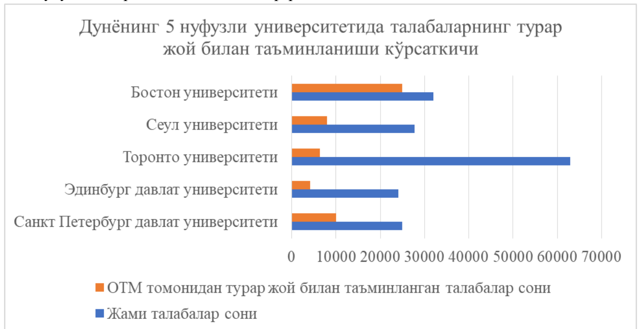
1-расм. Дунёнинг нуфузли университетларида талабаларнинг турар жой билан таъминланиш кўрсаткичи 1

Жанубий Кореяда ҳам “one-room” (бир хонали) услубидаги уйлар талабалар орасида юқори талаб кўрсаткичига эга. Шунингдек, Кореяда университетнинг ўзида ётоқхона ололмаган маҳаллий ва хорижий талабаларга турар жой топиш учун университетда хусусий агентликлар ёрдами тақлиф қилинади.