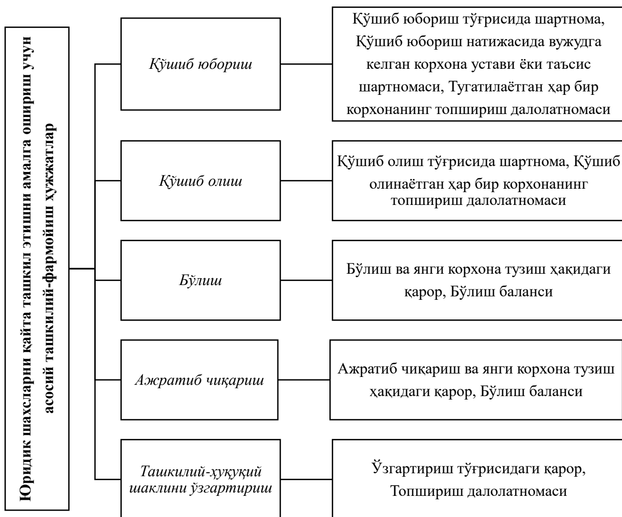
3-расм. Юридик шахсларни қайта ташкил этишда асос бўлувчи ташкилий-фармойиш ҳужжатлари 6

нормаларини умумлаштириб, бевосита жараёни амалга оширишда қўлланиладиган ташкилий-фармойиш ҳужжатларини тақдим этамиз (3-расм).