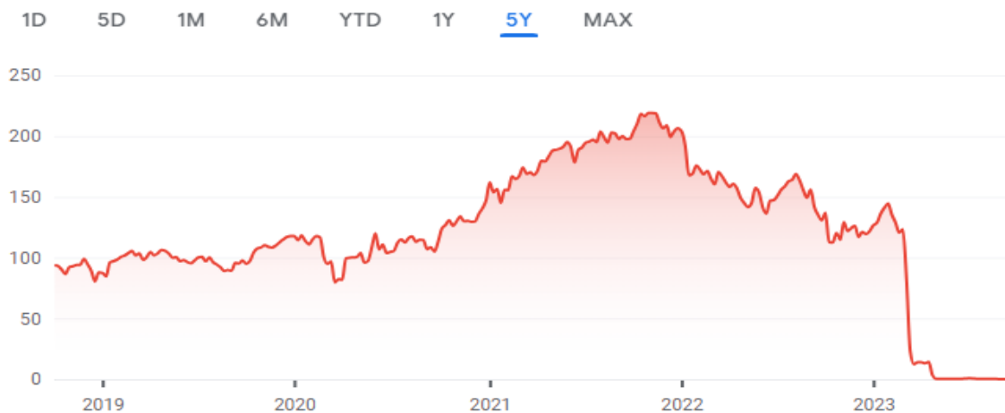
2-расм. First Republic Bank акциялари нархининг ўзгариши 3

Sep 29, 8:10:00 PM UTC-4 · USD · OTCMKTS · Disclaimer