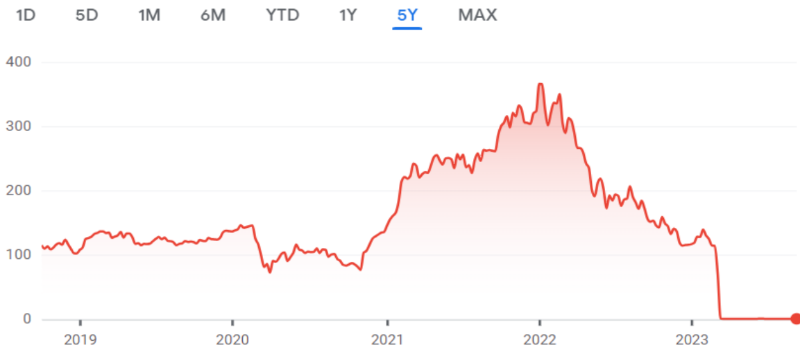
3-расм. Signature Bank акциялари нархининг ўзгариши 4

Sep 29, 8:10:00 PM GMT-4 · USD · OTCMKTS · Disclaimer